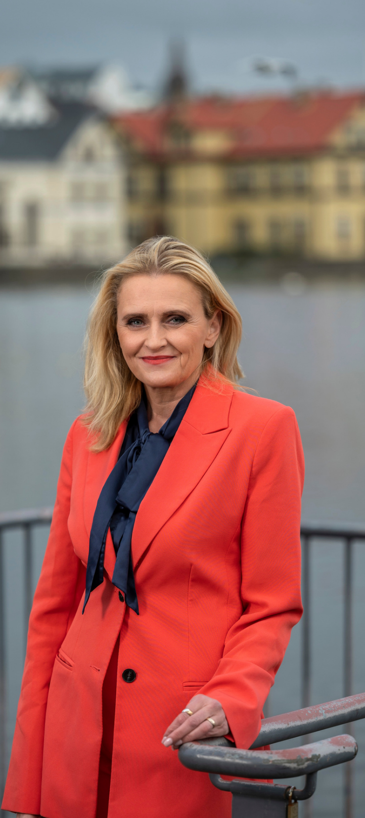
HEIÐA BJÖRG HILMISDÓTTIR FORMAÐUR STJÓRNAR SAMBANDS ÍSLENSKRA SVEITARFÉLAGA