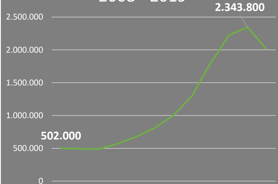
Fjöldi ferðamanna á Íslandi 2008 - 2019