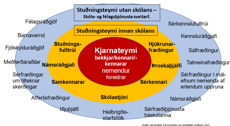
Mynd 3. Heildræn nálgun á stuðning við nemendur

Þegar leitast er við að mæta fjölbreyttum þörfum nemenda er mikilvægt að horfa til allra þeirra sem að málum koma til að tryggja heildræna nálgun . Hún felur í sér markvisst samstarf sérfræðinga innan mismunandi kerfa. Þá þarf samvinna allra aðila að taka jafnt til allra skólastiga þ.e. leik-, grunn- og framhaldsskóla. Á mynd 3 er dæmi um módel 9 þar sem dregin er upp heildarmynd af mismunandi stoðkerfum innan og utan skóla.