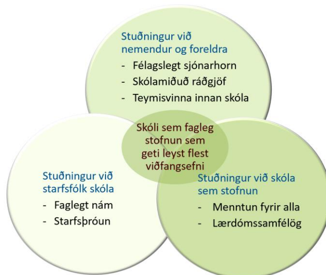
Mynd 1. Þjónustulíkan skólaþjónustu

Þriðji þátturinn í því þjónustulíkani sem hér er talað fyrir og sýnt er á mynd 1 er síðan stuðningur við skóla sem stofnun. Þetta er heldur ekki afmarkað verkefni, heldur í nánu samhengi við hin tvö. Hér er um að ræða stuðning við stærri verkefni sem taka til skólans í heild eða eininga innan hans, til dæmis sjálfsmat, viðbrögð við niðurstöðum ytra mats og viðfangsefni sem varða skólastarfið í heild og innleiðingu námskrár og menntastefnu. Í stefnumótun og umræðu um skólamál og rannsóknum og fræðilegum skrifum um þróun skólastarfs er ótvíræð áhersla á þróun skóla sem námssamfélaga og sammæli um mikilvægi þess að skólar eigi kost á stuðningi við slíkt þróunarstarf.