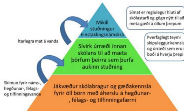
Mynd 2. Stigskiptur stuðningur í skólastarfi

fámennan hóp nemenda sem hefur þörf fyrir meiri og fjölþættari stuðning sem þarf að sækja til fagfólks utan skólans. Þessari þrepskiptu nálgun er lýst með mynd 2. 8