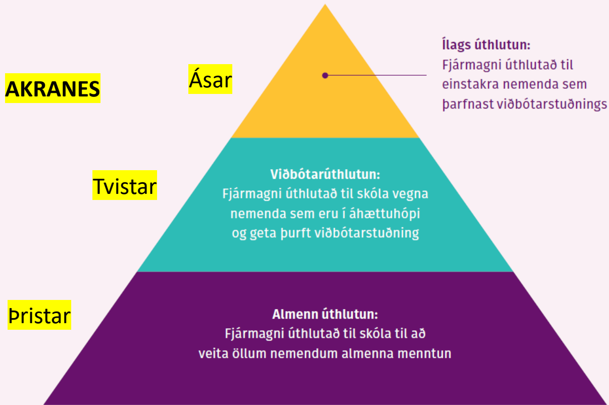
Líkan Evrópumíðstöðvar um ráðstöfun fjármuna

Ás - Nemandi þarf verulega aðstoð í öllu skólastarfi vegna skerðingar á færni og stuðningsaðila með sér allan skóladaginn auk umsjónar fagaðila