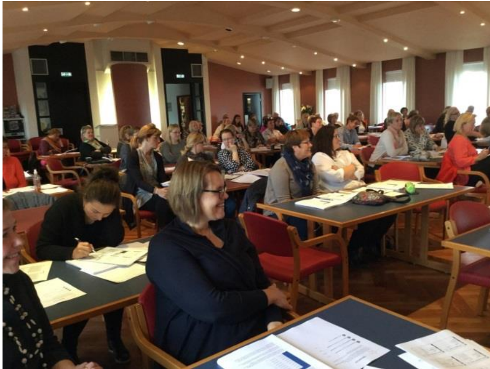
Fjölmargin kennarar sóttu PALS stærðfræðinámskeiðin

Nýjustu fréttir af SÍSL verkefninu eru að verkefnastjórinn hefur reynt að fá til liðs við verkefnið einstakling sem er tilbúinn til að þýða og staðfæra PALS lestrarhandbók fyrir 1. bekk. Vonandi mun viðkomandi geta hafið þýðinguna strax í byrjun næsta árs.